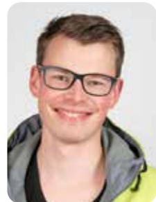
Felix Tech Gesundheits- und Krankenpflegerschüler Wahlbezirk: 080 GGG Wiehagen I